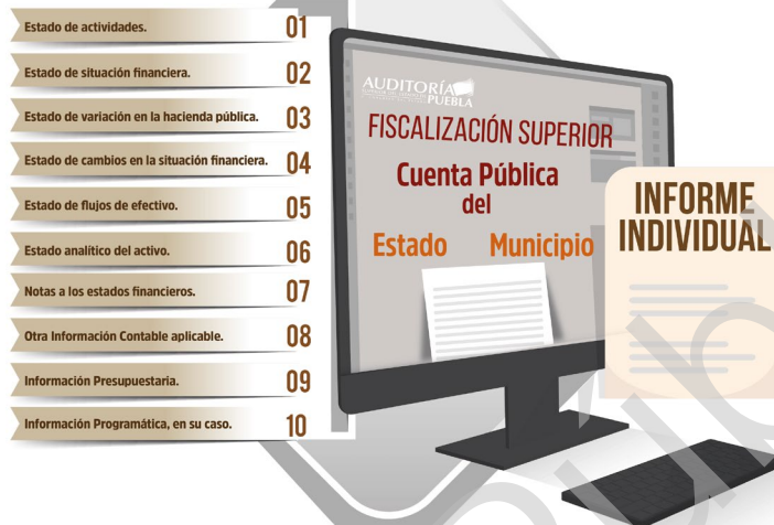
Diagrama 2 Enfoque a Procesos de la Fiscalización Superior 2017